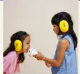
タッチ・ザ・サウンド・ピクニック