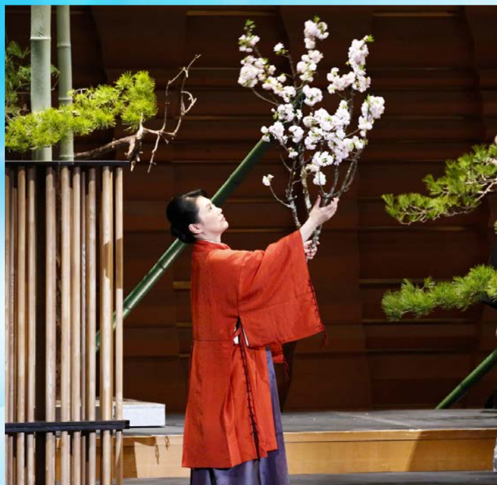
いけばな：池坊専好