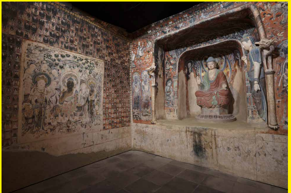
敦煌莫高窟第57窟 再現