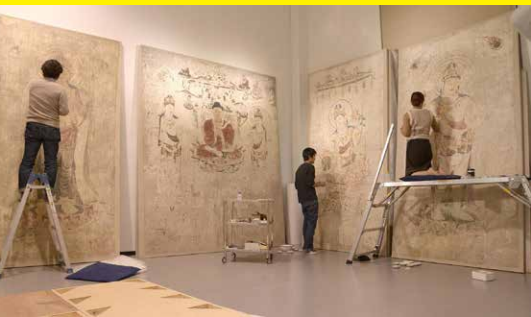
法隆寺金堂壁画再現作業風景