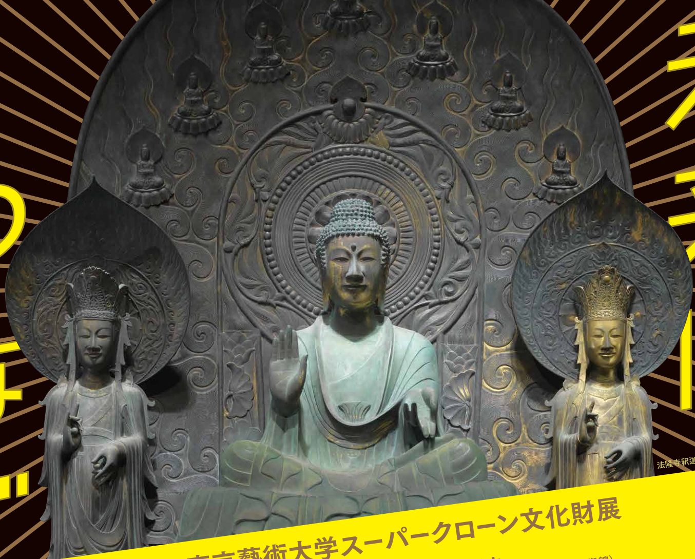
法隆寺釈迦三尊像再現