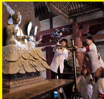
法隆寺釈迦三尊像の三次元計測風景