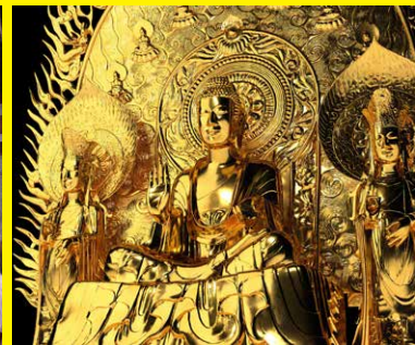
法隆寺釈迦三尊像 復元(CGによる再現)