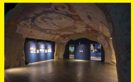
バミヤン東大仏天井壁画 再現

※新型コロナウイルス感染症等、諸般の事情により、会期等に変更が生じる場合があります。最新情報は美術館ホームページをご覧ください。 ※本展の展示作品は、全て撮影が可能です。