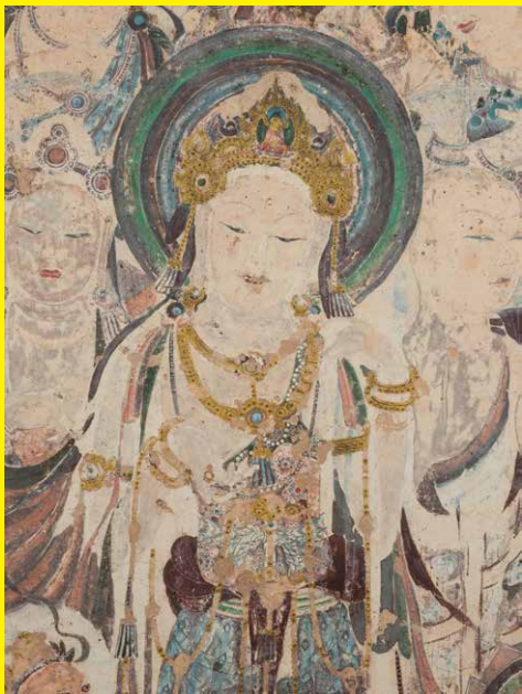
敦煌莫高窟第57窟 再現(部分)