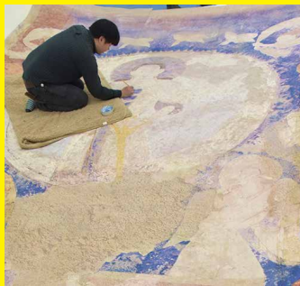
バミヤン東大仏天井壁画再現作業風景