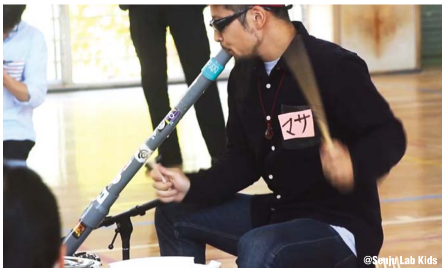
@Senju Lab Kids

当日は、Facebookにてイベント内容をレポートしていきます！ 【キッズセーバー公式FB】 http://www.facebook.com/kids.saver