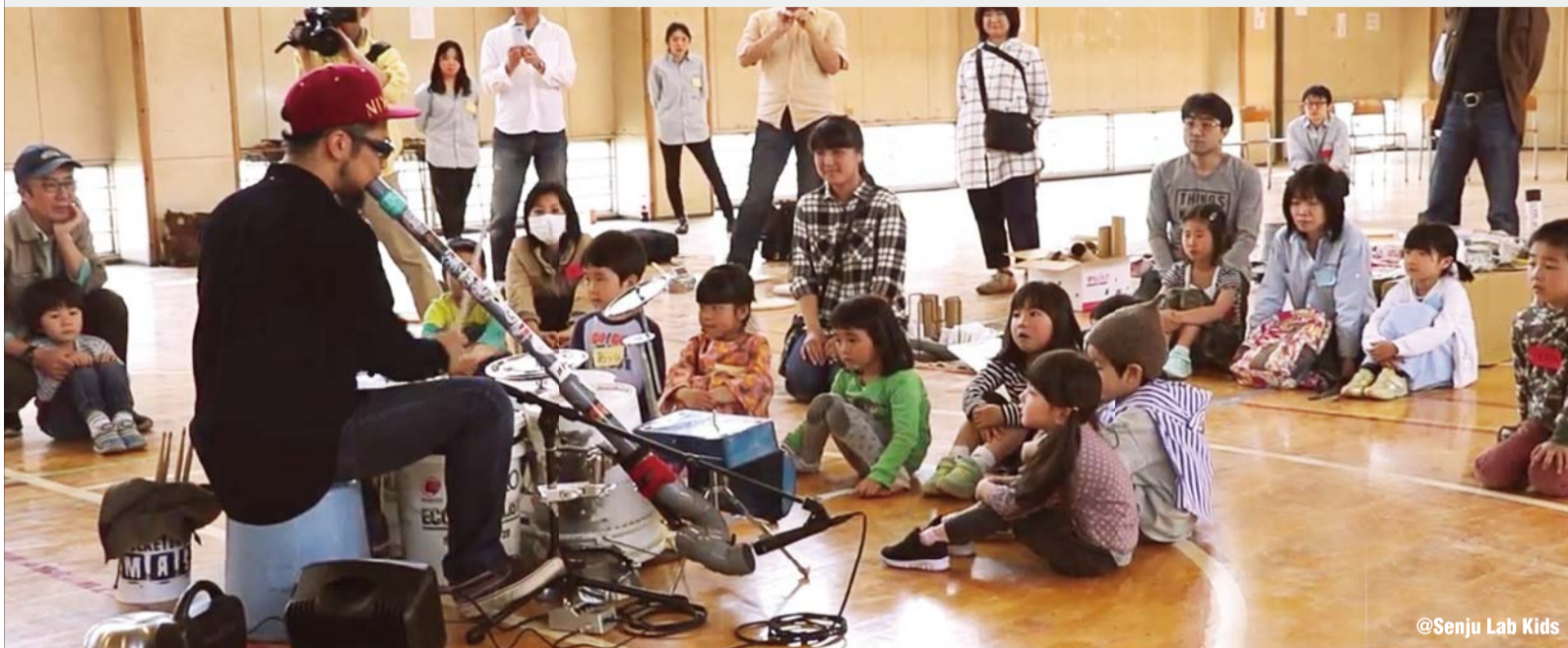
@Senju Lab Kids