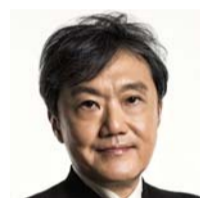
キッズ・手作り楽器・ チャレンジ 千住明先生

作曲家。日本を代表する作曲家・編曲家・ 音楽プロデューサー。ポップスから映像 音楽、クラシックやオペラまで幅広い分野 の音楽を手がけ、グローバルに活躍。東 京藝大特任教授として美術と音楽のワー クショップ、Senju Lab 主宰。