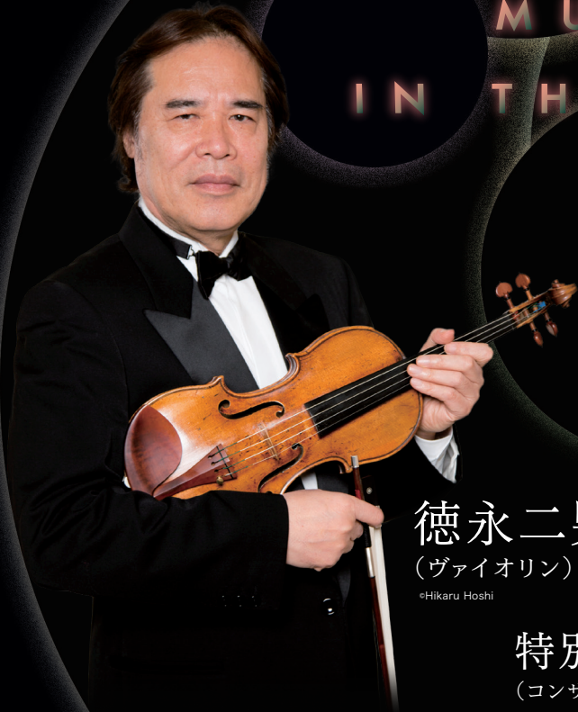
徳永二男 (ヴァイオリン)