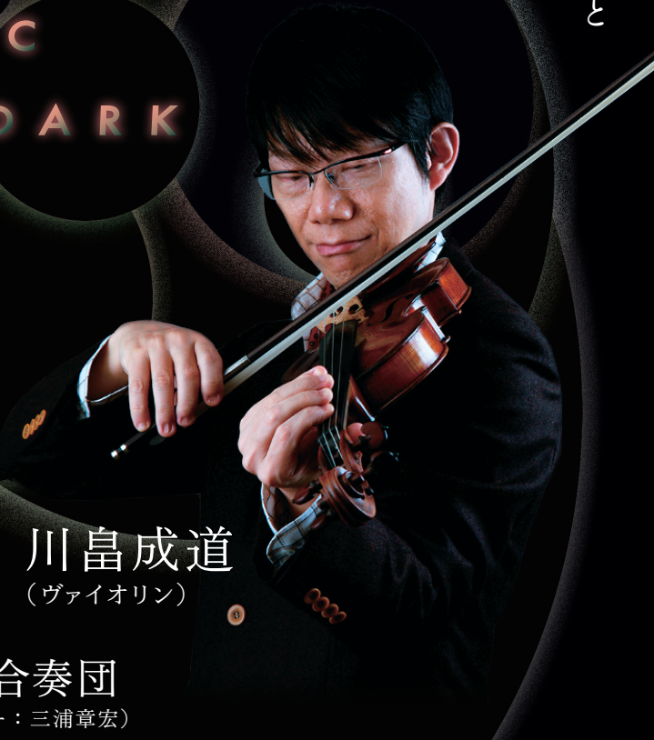
川島成道 (ヴァイオリン)