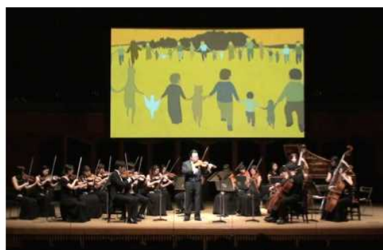
写真：北九州公演の様子