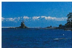
国定公園 雨晴海岸