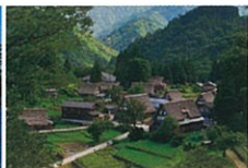
世界文化遺産 五箇山合掌造り集落