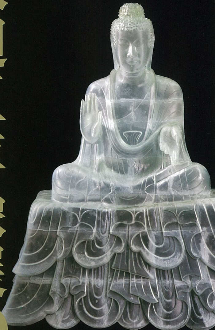
3Dプリンターで作った原型